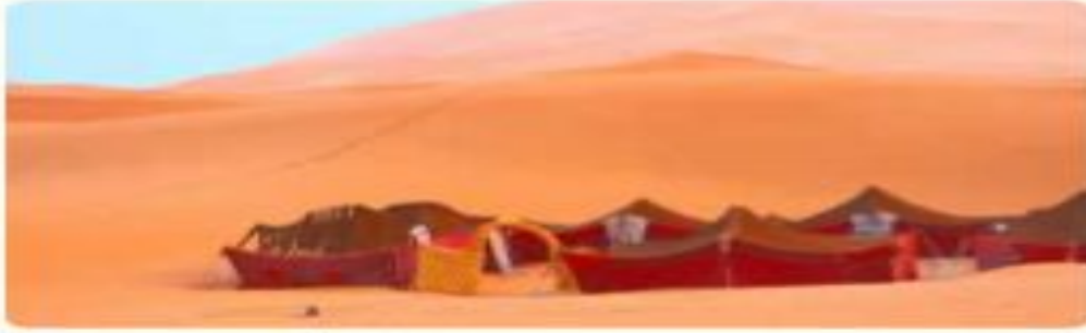
أرض استقرت فيها قبيلة بدوية

نظّر إلى الصور الثلاث ثم ناقش النقاط التالية.