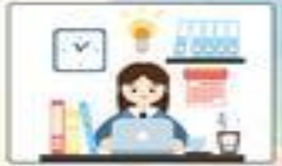
الجلوس في مكان مناسب