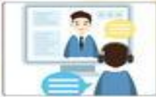
الالتباه والتفاعل مع المعلم