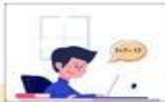
الحرص على حل الواجبات