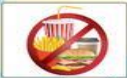
الأكل ممنوع أثناء الدرس