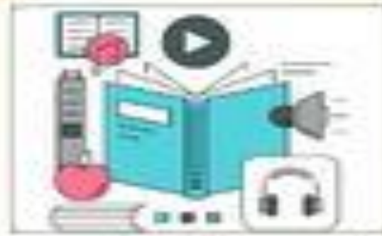
تأكد من اتصالك و أدواتك