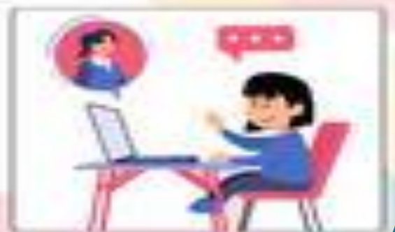
التطاف بالحدوث مع الزملاء