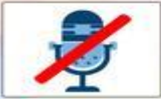
المحافظة على الهدوء