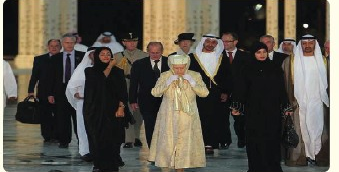
الملكة إلبابب بزور "مسبب الشبب زابب الببب"

1. في مشتهل زبارة ملكة بريطانيا إلبابب البانبة إلى دولة الإمارات العربية المتحدة، ببحولب في "مسبب الشبب زابب الببب"، في العاصمة الإماراتبة أبوبب. ولدى ذبول الملكة ساحة المسبب بلبب بباءها وازببب ما بشبب البباءة، وعباء كاملاً للرباس، صببما ببببب للزبابة.