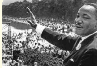
مارتن لوثر كينغ في واشنطن أثناء خطابه "لدي حلم"

للمبتدئين والمتقدمين: ( يشترك الصف بأكمله لتفادي التمييز بين الطلبة على أساس المستوى) يعبرون عن تقبلهم لاختلافهم من حيث القدرات والميول ويتحاورون حول احتياجاتهم حتى يتعاونوا على تليبيتها.