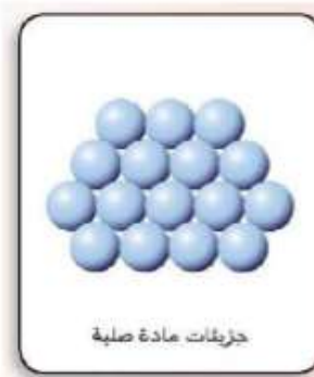
جزيئات مادة صلبة