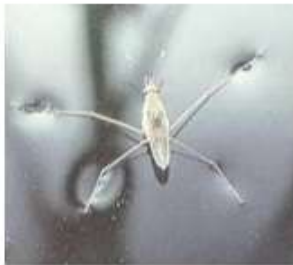
بعوضة تمشي على الماء ظاهرة التوتر السطحي

يحدث التوتر السطحي بسبب أن كل جزيء يجذب تجاه الجزيئات الأخرى، فيتالي يكون غشاء على السطح.