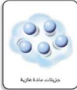
جزيئات مادة غازية