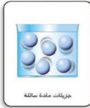
جزيئات مادة سائلة