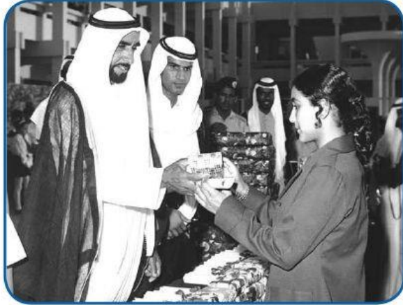
السَّيِّحُ زَايِدُ بْنُ سُلْطَانَ آلِ نَهْيَانَ - رَحِمَهُ اللَّهُ - يَكْرُمُ أَحَدَى الطَّالِبَاتِ الْمَتَّفِقَاتِ