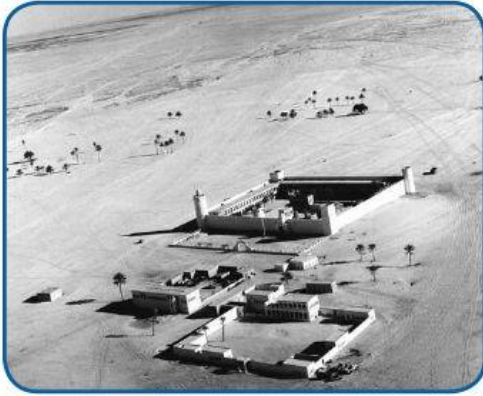
قصر الحصن بأبوظبي

وُلِدَ الشَّيْخُ زَايِدُ بْنُ سُلْطَانَ آلِ نَهْيَانَ -رَحِمَهُ اللهُ- فِي قَصْرِ الْحِصْنِ فِي أَبُو ظَبْيٍ عَامَ 1918م. وَالِدُهُ الشَّيْخُ سُلْطَانُ بْنُ زَايِدِ بْنِ سُلْطَانَ آلِ نَهْيَانَ -رَحِمَهُ اللهُ، وَأُمُّهُ الشَّيْخَةُ سَلَامَةُ ابْنَةُ بَطِي بْنِ خَادِمٍ -رَحِمَهَا اللهُ، وَقَدْ سَمِيَ عَلَى اسْمِ جَدِّهِ الشَّيْخِ زَايِدٍ -رَحِمَهُ اللهُ، وَهُوَ الْإِبْنُ الْأَصْغَرُ بَيْنَ أَرْبَعَةِ إِخْوَةٍ.