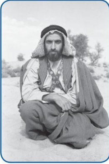
السَّيِّحُ زَايِدُ بْنُ سُلْطَانَ آلِ نَهْيَانَ - رَحِمَهُ اللَّهُ - فِي شَبَابِهِ