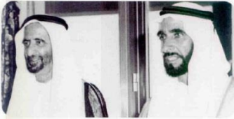
السَّيِّحُ زَايِدُ بْنُ سَعِيدِ آلِ مَكْتومٍ - رَجَمَهُ اللهُ -