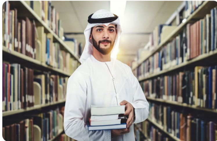
المواطن الصالح فخر لأهله ووطنه.