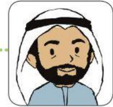
خَالِي (أَخُو أُمِّي)

أَحِبُّ جَدِّي وَجَدَّتِي وَخَالِي وَخَالَتِي وَجَمِيعَ أَقَارِبِي