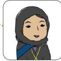
خَالَتِي (أُخْتُ أُمِّي)