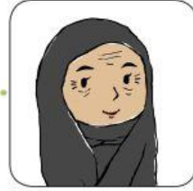
جَدَّتِي (وَالِدَةُ أُمِّي)