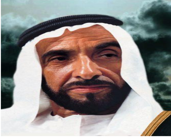
سمو الشيخ ..... رحمه الله .

6 - اكتب اسم الشخصية أسفل كل صورة مما يأتي :- 3 درجات