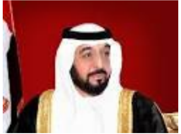
سمو الشيخ ..... حفظه الله .