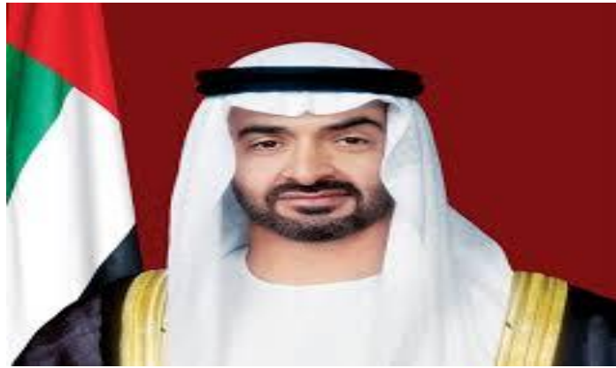
سمو الشيخ ..... حفظه الله .